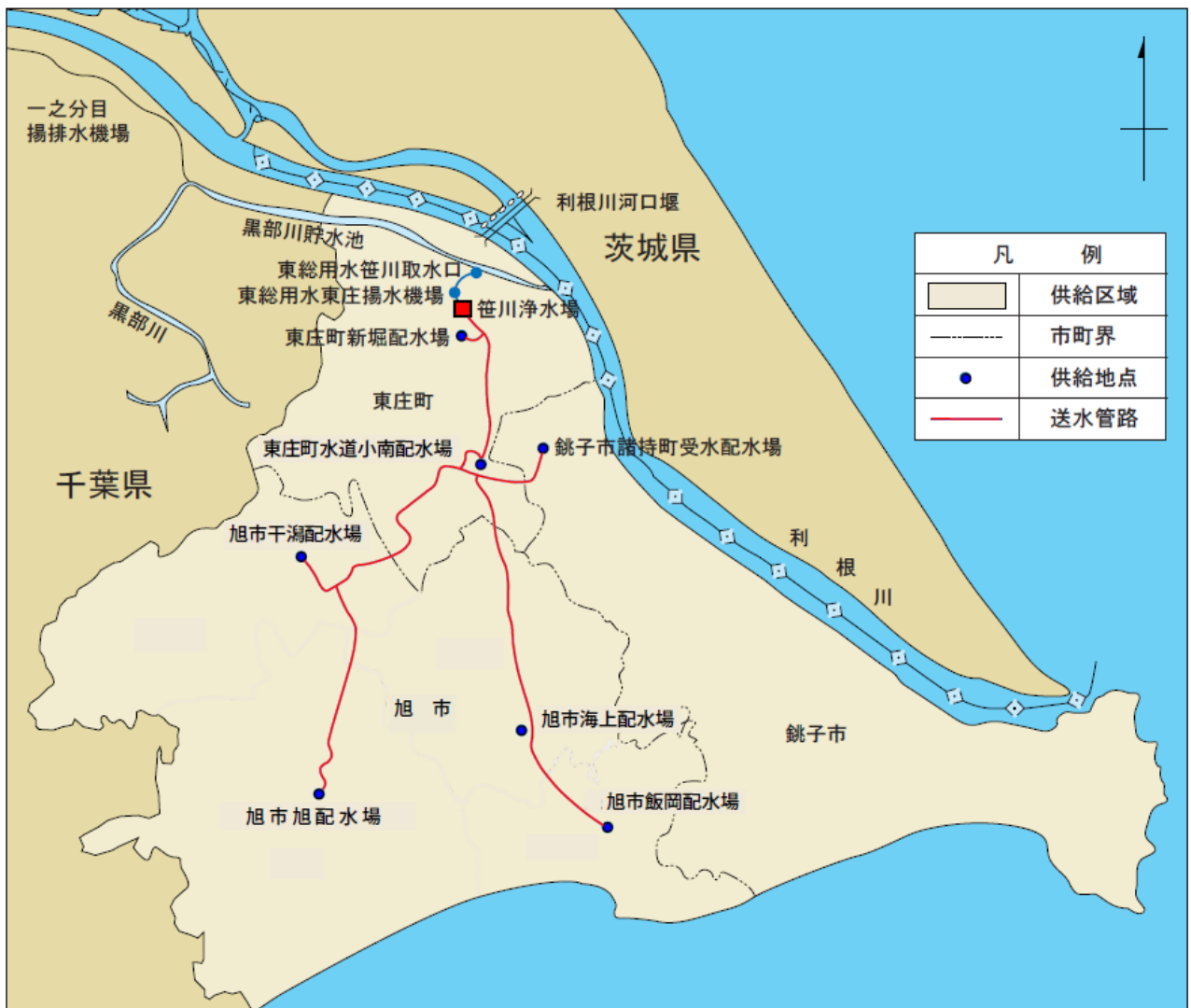
図－２ 構成団体への水道用水受け渡し地点